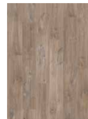
CARVALHO MARROM CANYON