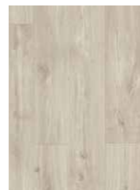
CARVALHO BEGE CANYON