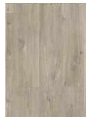
CARVALHO MARROM CLARO CANYON COM CORTES DE SERRA