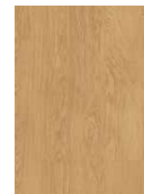
CARVALHO NATURAL SELECT