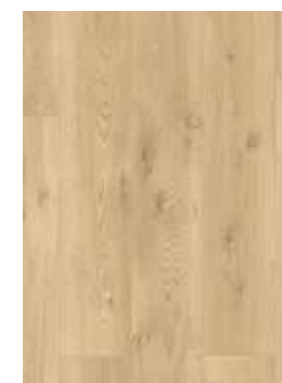
CARVALHO BEGE DRIFT