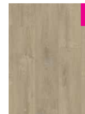
CARVALHO AREIA DE VELUDO