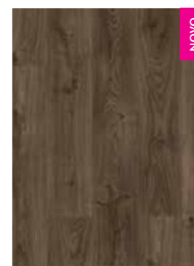
CARVALHO COTTAGE MARROM ESCURO