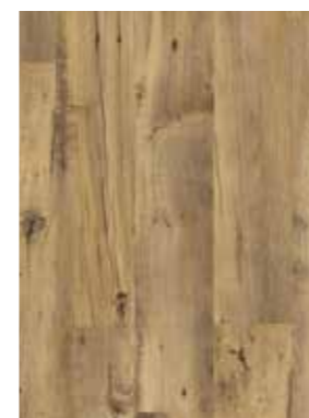
CASTANHEIRO NATURAL VINTAGE